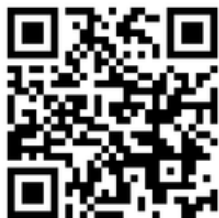
高崎ロータリークラブ基金 募集内容